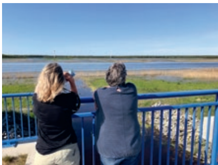
Beobachtung in der Werre

9:00–12:00 Uhr Fahrradexkursion zu den Küstenvögeln Parkplatz Ahrenshooper Schifferkirche des Werrepolders Im Rahmen des Projektes „Vernetzte Vielfalt an der Schatzküste“ laden wir Sie zu einer Fahrradexkursion entlang des renaturierten Werrepolders zwischen Ahrenshoop und Born ein. Bitte bringen sie eigene Ferngläser zum Beobachten der Rast- und Brutvogelarten mit. HINWEIS: Ausfall der Veranstaltung bei schlechter Witterung möglich. Dazu bitte aktuelle Bekanntmachungen auf www.bodden-nationalpark.de prüfen.