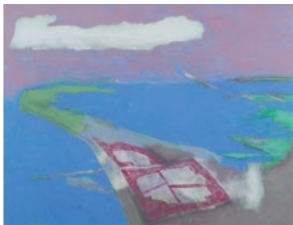
Sarah Schumann Darß, 2008 Pigmentmalerei auf Holz VAN HAM Art Estate Köln © VG Bild-Kunst, Bonn 2024