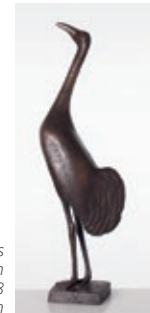
Gerhard Marcks Rufender Kranich Bronze, 1938

Gerhard Marcks (1889– 1981) schuf etliche Skizzen nach den imposanten Vögeln, daneben Druckgrafik und fünf plastische Versionen, die nun anlässlich des fünfundfünfzigjährigen Bestehens der B14 erstmalig alle in einer Ausstellung zu sehen sind.