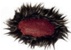
Karelian Pie III Objekt 2023