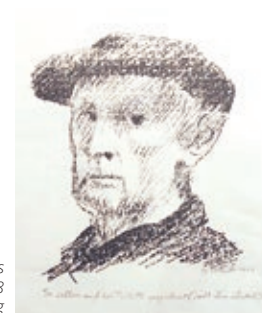
Gerhard Marcks Selbstbildnis, 1948

In einer mit Lotta Nebeling (Kunstmuseum Ahrenshoop) kuratierten Ausstellung werden Arbeiten des Bildhauers, Grafikers & Zeichners Gerhard Marcks (1889–1981) aus der Sammlung Frühauf gezeigt.