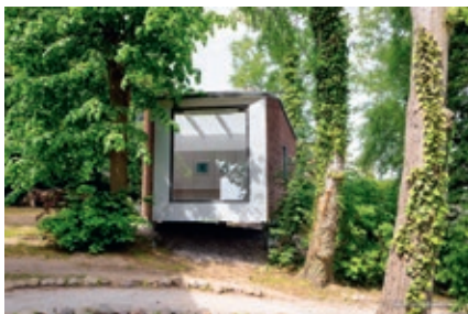
Open Gallery Day im Atelier Josepha

11:00–12:00 Uhr Open Gallery Day im Atelier Josepha Schifferkirche Ahrenshoop 12:30–17:00 Uhr mit Konzert & Lesung in der Schifferkirche Atelier Josepha Ahrenshoop sowie Ausstellung der Arbeiten der Josepha-Stipendiat:innen in der Künstler:innenresidenz Atelier Josepha