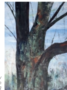
Barbara Nowy Baum-Inspiration Acryl, gespachtelt, 2023