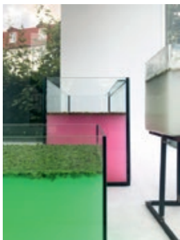
Installation © Marie Luise Holländer

Die Ausstellung präsentiert junge Künstlerin- nen & Künstler aus MV und dem Ostseeraum.