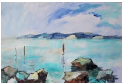
Manfred Prinz Stille Bucht Öl auf Leinwand, 2022