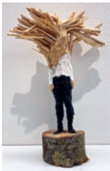
Edvardas Racevicius o.T., 2022 Holz, Acryl, ca. 38 cm

Es werden Arbeiten der Galeriekünstler gezeigt.